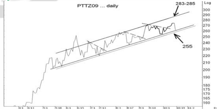
Figure 5: PTTZ09 Futures