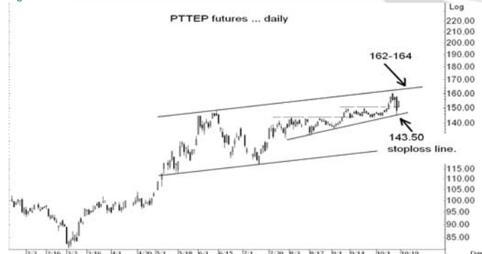
Figure 4: PTTEPZ09 Futures