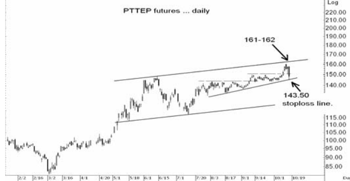
Figure 4: PTTEPZ09 Futures