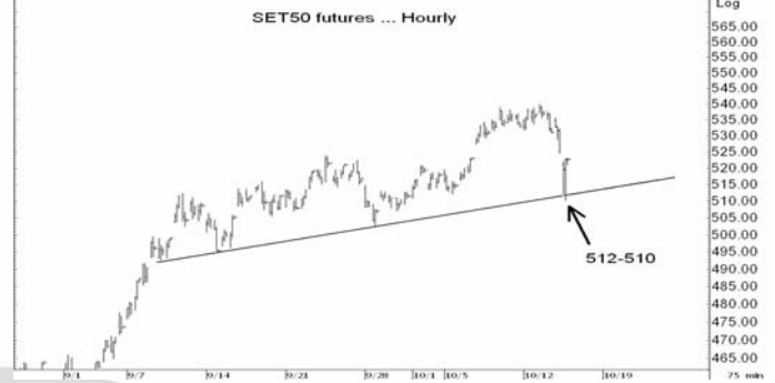
Figure 3: SET50 Futures Premium