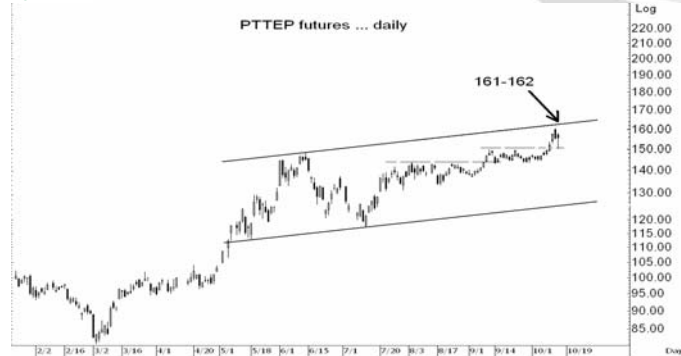
Figure 4: PTTEPZ09 Futures