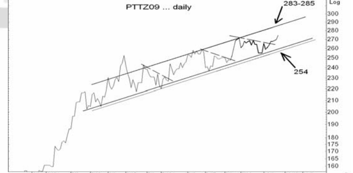
Figure 5: PTTZ09 Futures