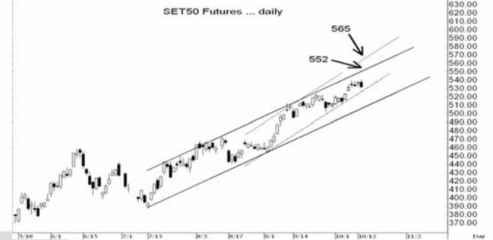
Figure 3: SET50 Futures Premium