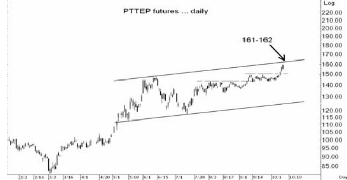
Figure 4: PTTEPZ09 Futures