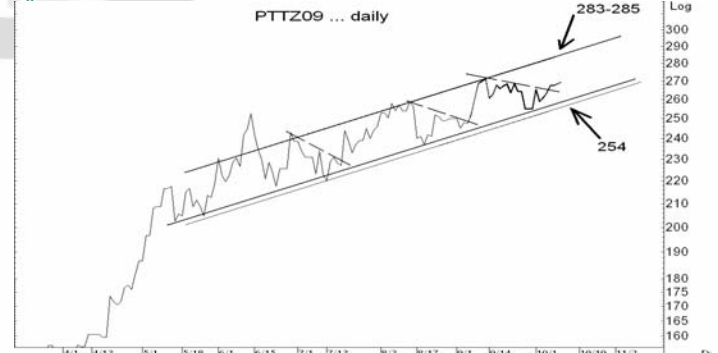
Figure 5: PTTZ09 Futures