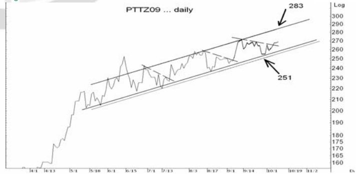
Figure 5: PTTZ09 Futures