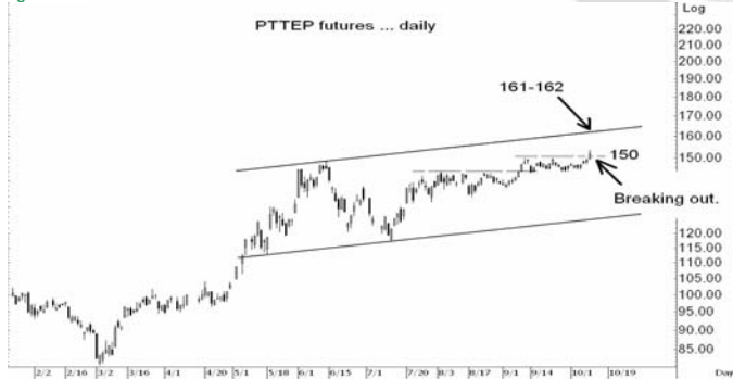
Figure 4: PTTEPZ09 Futures