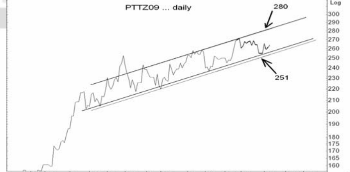
Figure 5: PTTZ09 Futures