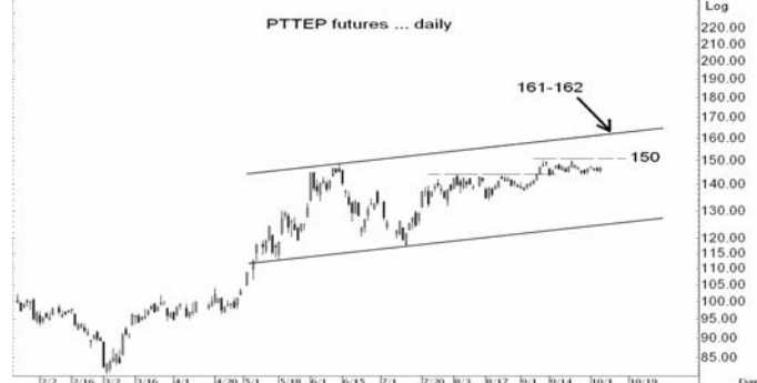
Figure 4: PTTEPZ09 Futures