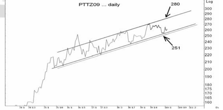
Figure 5: PTTZ09 Futures