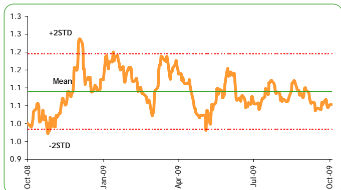
Figure 6: Price Relative Between PTTEP / PTT