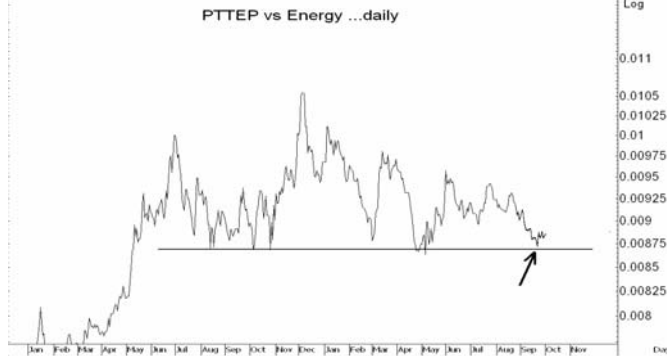
Figure 4: PTTEP vs Energy