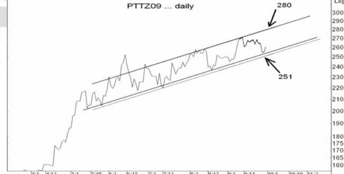
Figure 5: PTTZ09 Futures