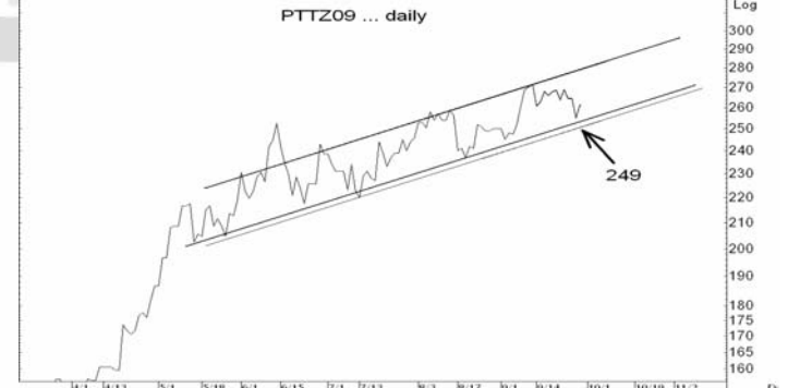
Figure 5: PTTZ09 Futures