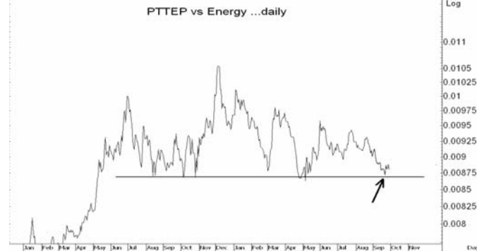
Figure 4: PTTEP vs Energy