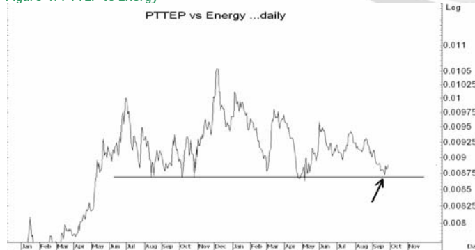
Figure 4: PTTEP vs Energy