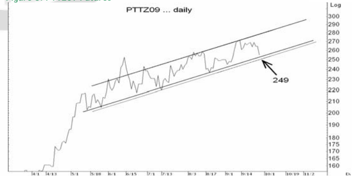
Figure 5: PTTZ09 Futures