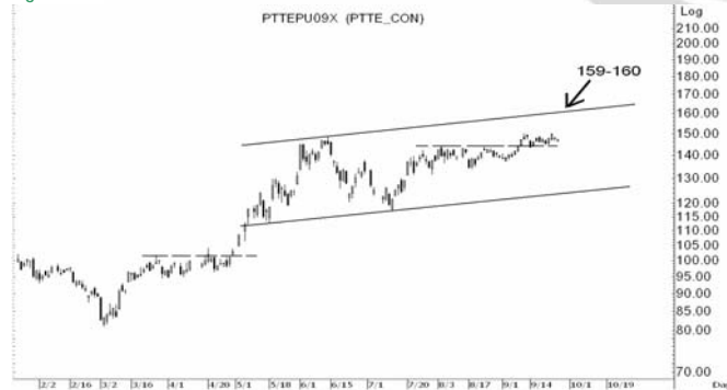
Figure 4: PTTEPU09 Futures