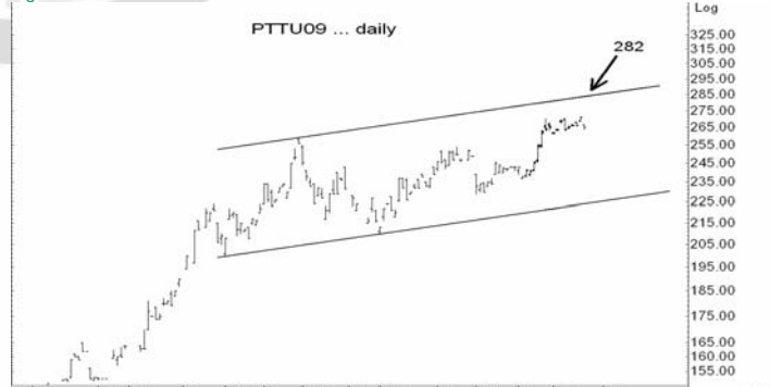
Figure 5: PTTU09 Futures