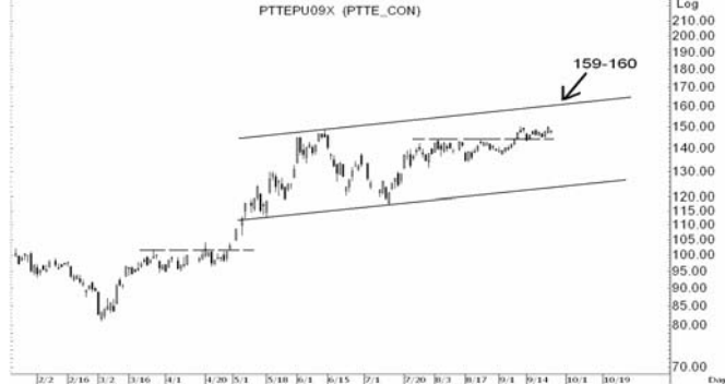
Figure 4: PTTEPU09 Futures