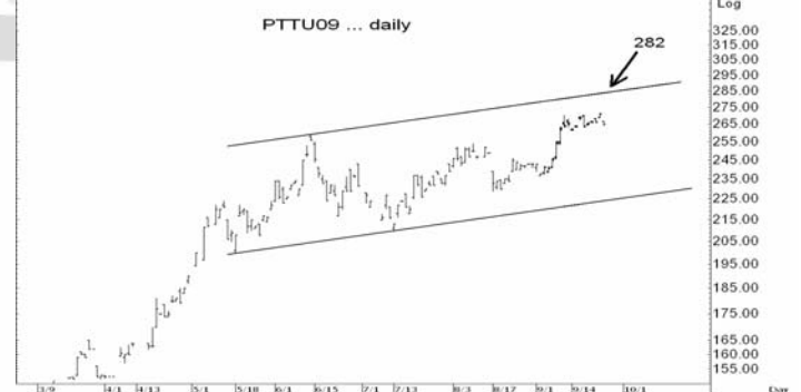
Figure 5: PTTU09 Futures