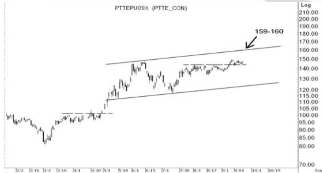
Figure 4: PTTEPU09 Futures