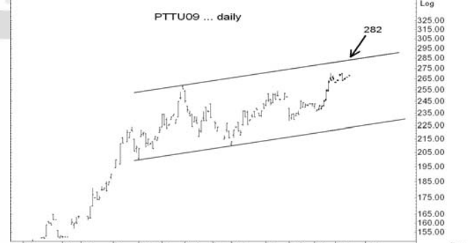
Figure 5: PTTU09 Futures