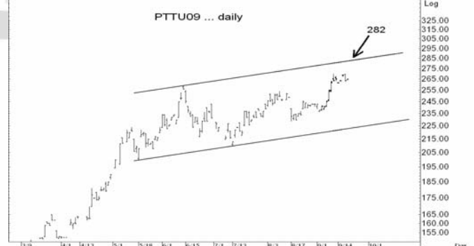
Figure 5: PTTU09 Futures