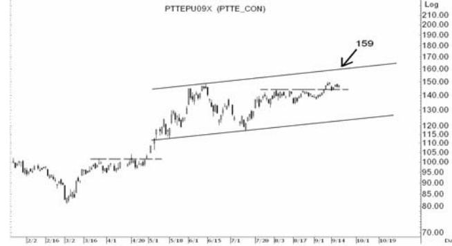
Figure 4: PTTEPU09 Futures