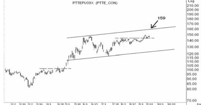
Figure 4: PTTEPU09 Futures