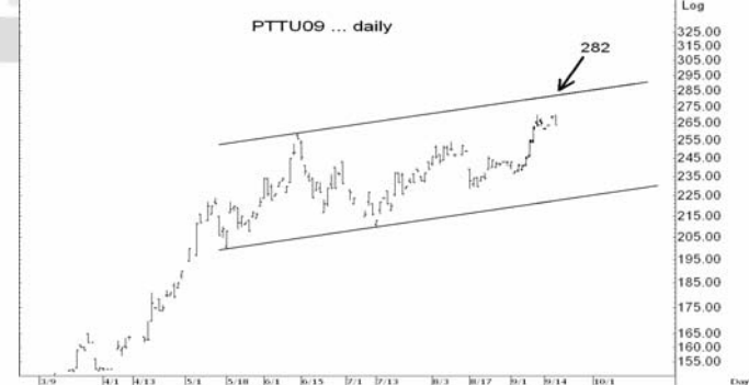
Figure 5: PTTU09 Futures