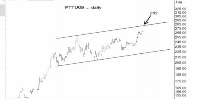
Figure 5: PTTU09 Futures