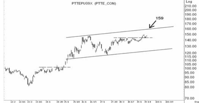
Figure 4: PTTEPU09 Futures