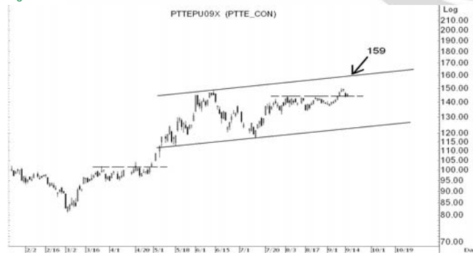
Figure 4: PTTEPU09 Futures