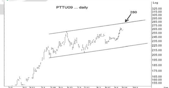
Figure 5: PTTU09 Futures