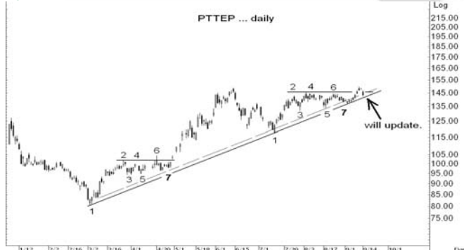
Figure 4: PTTEP Spot