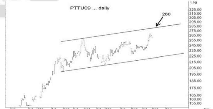
Figure 5: PTTU09 Futures