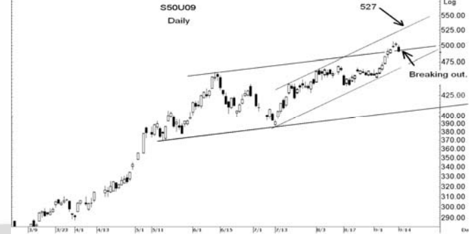
Figure 3: SET50 Futures Premium