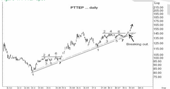
Figure 4: PTTEP Spot