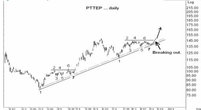
Figure 4: PTTEP Spot