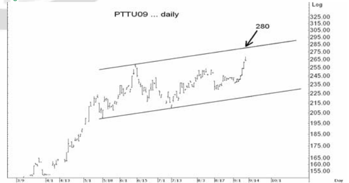
Figure 5: PTU09 Futures