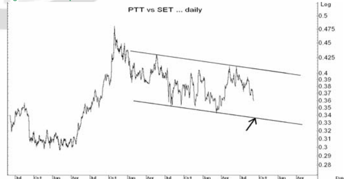
Figure 5: PTT Spot vs SET Index