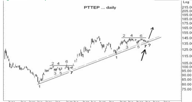
Figure 4: PTTEP Spot