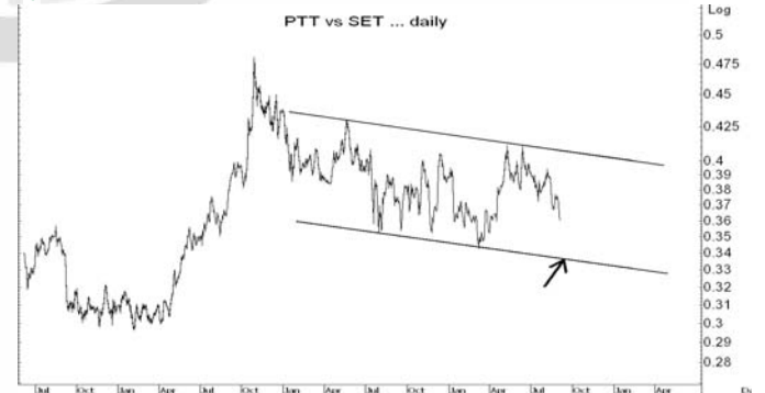
Figure 5: PTT Spot vs SET Index