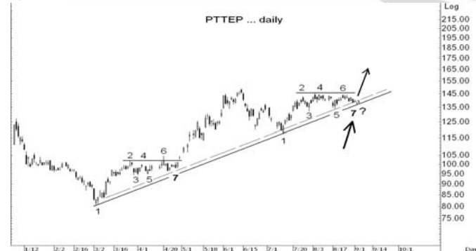
Figure 4: PTTEP Spot