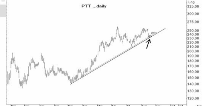
Figure 5: PTT Spot