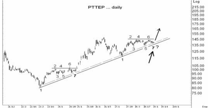
Figure 4: PTTEP Spot