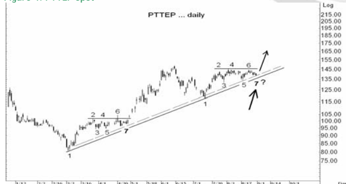
Figure 4: PTTEP Spot