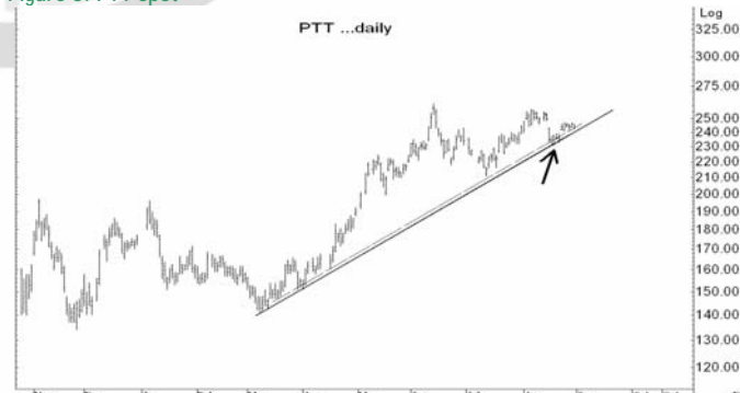
Figure 5: PTT Spot