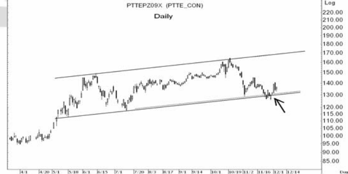
Figure 5: PTTEPZ09 Futures