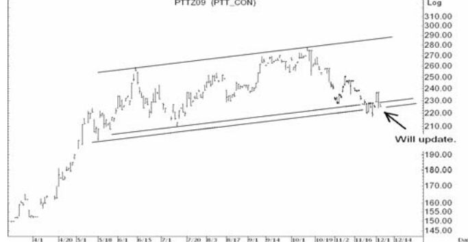
Figure 4: PTTZ09 Futures