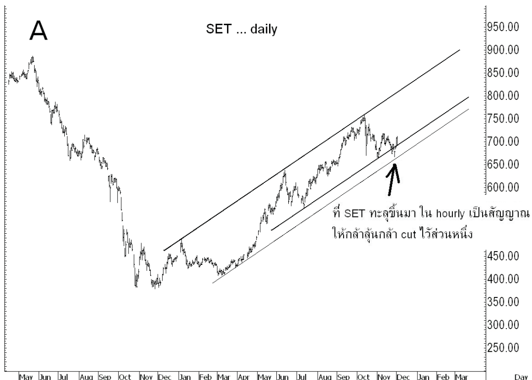
ที่ SET ทะลุขึ้นมา ใน hourly เป็นสัญญาณให้กล้าสั้นกล้า cut ไม้ส่วนหนึ่ง

แนวต้าน 696, 700-702 และ ? แนวรับ 690-688 และ ?