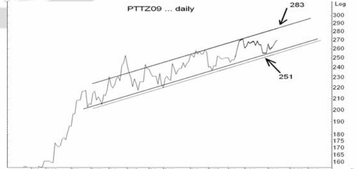
Figure 5: PTTZ09 Futures