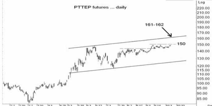
Figure 4: PTTEPZ09 Futures