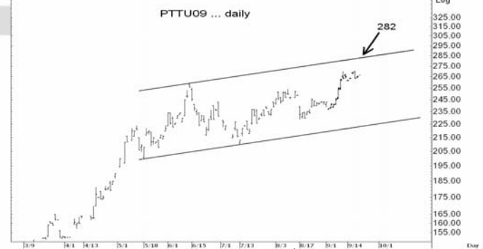
Figure 5: PTTU09 Futures