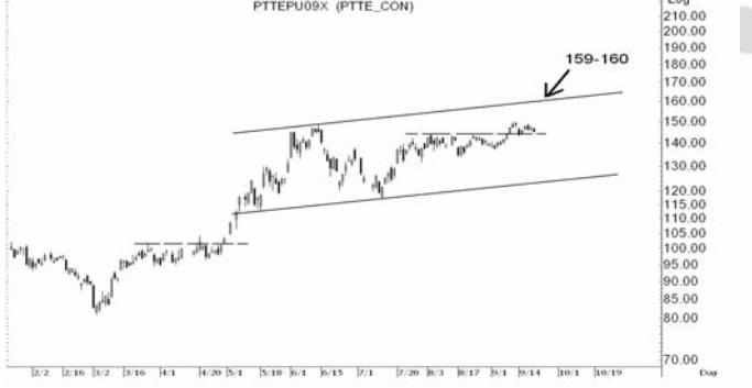
Figure 4: PTTEPU09 Futures