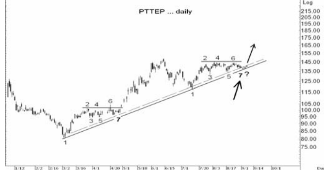
Figure 4: PTTEP Spot