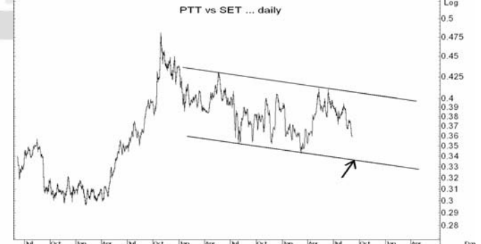
Figure 5: PTT Spot vs SET Index